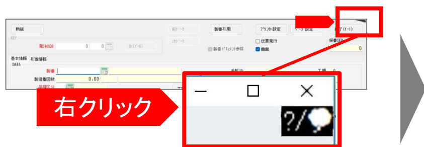
[メッセージ入力画面]